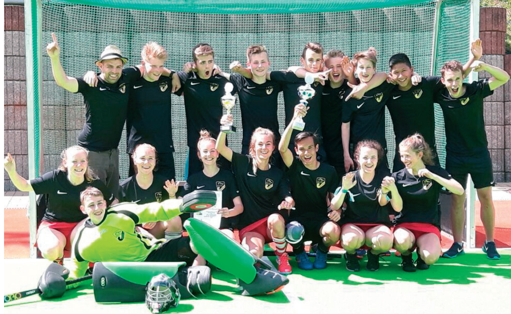
TURNIERSIEGER IN NEUNKIRCHEN JUNI 2017

HOCKEY IN OFFENBURG FEIERT 2019 SEINE 100-JÄHRIGE TRADITION!