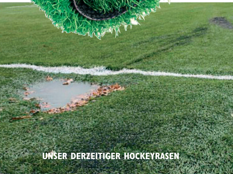
UNSER DERZEITIGER HOCKEYRASEN